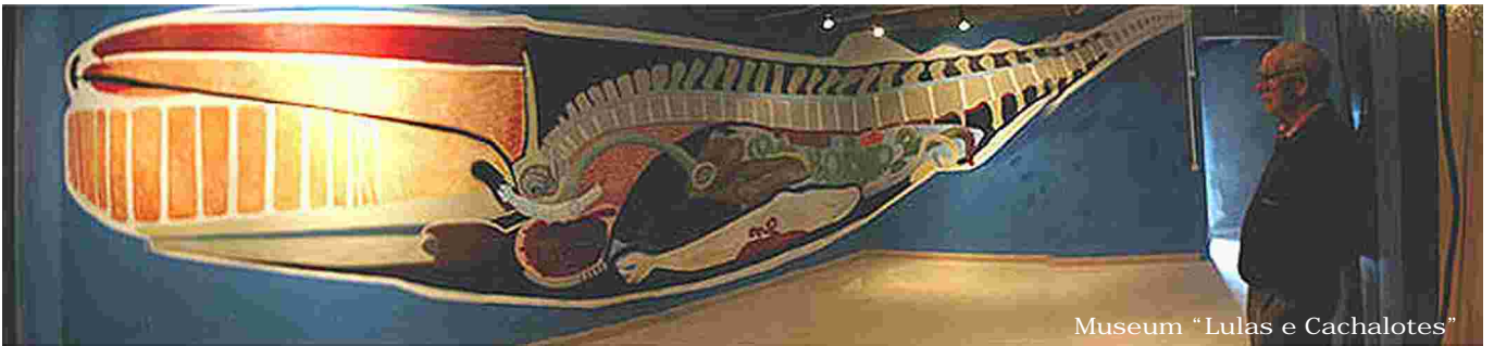
Museum "Lulas e Cachalotes"

In Piedade, an der östlichen Spitze der Insel, können Sie "ein anderes Pico" entdecken, und zwar auf dem Rücken der Pferde... Käse und hiesiger Wein dürfen beim Picknick in der "Adega" (in Basalt gehauener Keller) in Nélia natürlich ebenfalls nicht fehlen.