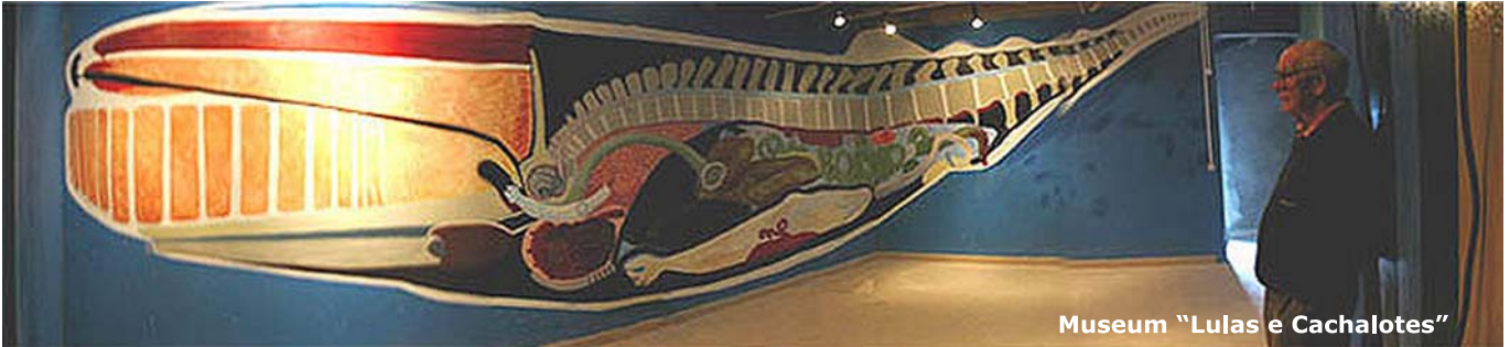
Museum "Lulas e Cachalotes"

Sie können diese ohne Führung vorgesehenen Wanderungen mit Ausnahme der Besteigung des Mont Pico an den halben freien Tagen unternehmen, an denen keine Meereseckursionen stattfinden. Die eventuell anfallenden Transportkosten müssen Sie selber tragen.